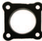
30.355 - BBS