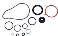
CÓD. 80.707-KB DESC. KIT DE BORRACHAS MAT. BBS N.ORIG.