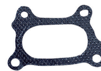
CÓD. 80.704-CH DESC. JUNTA DO COLETOR DO ESCAPAMENTO MAT. CH N.ORIG.