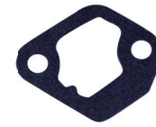
CÓD. 80.705-BBS DESC. JUNTA MAT. BBS N.ORIG.