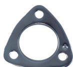
CÓD. 30.453 JE DESC. JUNTA DA SAÍDA DO ESCAPAMENTO MAT. CHA N.ORIG.