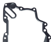
CÓD. 30.382 JB DESC. JUNTA DA BOMBA DE ÓLEO MAT. CH N.ORIG.