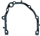
CÓD. 40.527 JB DESC. JUNTA DA BOMBA DE ÓLEO