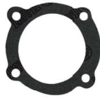
CÓD. 40.515-JB DESC. JUNTA BOMBA D'AGUA