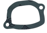
CÓD. 40.525 JT DESC. JUNTA DA VÁLVULA TERMOSTÁTICA