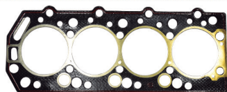
CÓD. 140.001 OIL DESC. JUNTA DO CABEÇOTE (SOFT) MAT. BBS N.ORIG.