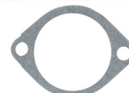
CÓD. 140.031 JD DESC. JUNTA DO TERMOSTATO MAT. NA N.ORIG.