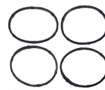
CÓD. 30.357 KB DESC. KIT DE JUNTAS COLETOR DE ADMISSÃO