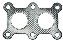
CÓD. 30.657 CH DESC. JUNTA DA SAÍDA DO ESCAPAMENTO