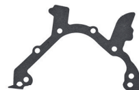
CÓD. 30.656 PV DESC. JUNTA DA DISTRIBUIÇÃO