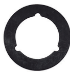
CÓD. 30.359 BO DESC. ARRUELA DE VEDAÇÃO