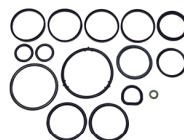
CÓD. 30.348/8 KB DESC. KIT DE BORRACHAS