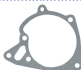
CÓD. 140.410 JT DESC. JUNTA DA TAMPA DA BOMBA D'ÁGUA MAT. NA N.ORIG.